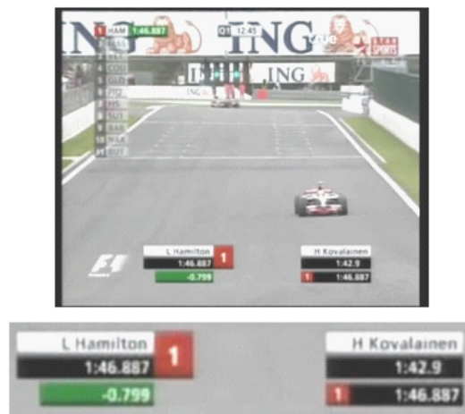
ภาพตัวอย่าง ลักษณะการเสนอข้อมูลการเล่นโดยกราฟิก ในรายการถ่ายทอดสด