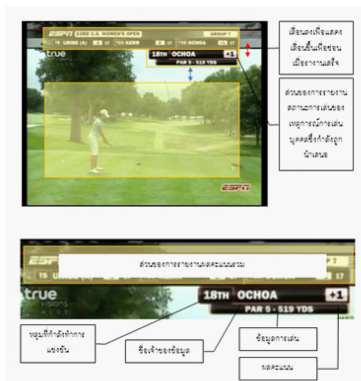
ภาพตัวอย่าง กราฟิกการรายงานผลคะแนนและการเล่นในรายการถ่ายทอดสดการแข่งขันกีฬาอล์ฟ

ลักษณะของการเป็นรหัสร่วมของการถ่ายทอดสดการแข่งขันปรากฏในลักษณะของ ผลคะแนน สถานะการเล่น (อันเกิดจากกติกาและรูปแบบของการแข่งขัน) การปรากฏของข้อมูล (อันเนื่องมาจากข้อกำหนดในการจัดการแข่งขัน) และลักษณะของการออกแบบกราฟิกร่วม (อันเกิดจากธรรมเนียมของรายการแข่งขัน)