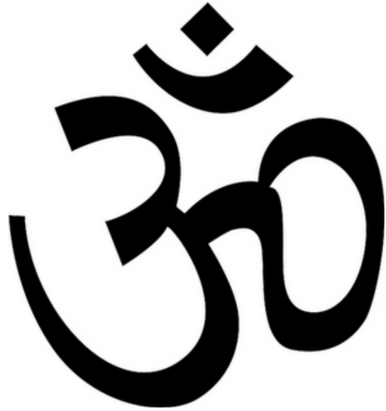
รูป 5 สัญลักษณ์ โอม

สัญลักษณ์อุณาโลมมีปรากฏอยู่ในเทวรูปในศาสนาฮินดู ประเทศอินเดีย มาตั้งแต่ยุคอินเดียบราณโดยการเป็นสัญลักษณ์มาจาก อักขระ “โอม” โดยมีการลดทอนสัญลักษณ์มาเรื่อยๆ จนท้ายที่สุดมีลักษณะคล้ายเลขหนึ่งหรือเลขเก้าไทยในที่สุดนั่นเอง ตามคติฮินดู คำว่า ‘อุณาโลม’ ในคติฮินดูมาจาก คำว่า “โอม” ซึ่งเกิดจากการผสมคำระหว่าง อุ อะ มะ โดยทางศาสนาฮินดูหมายถึงเทพเจ้าทั้งสาม