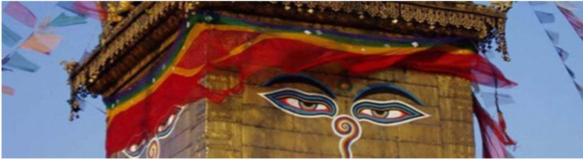
รูป 2 สัญลักษณ์ Buddha eye ในประเทศเนปาล