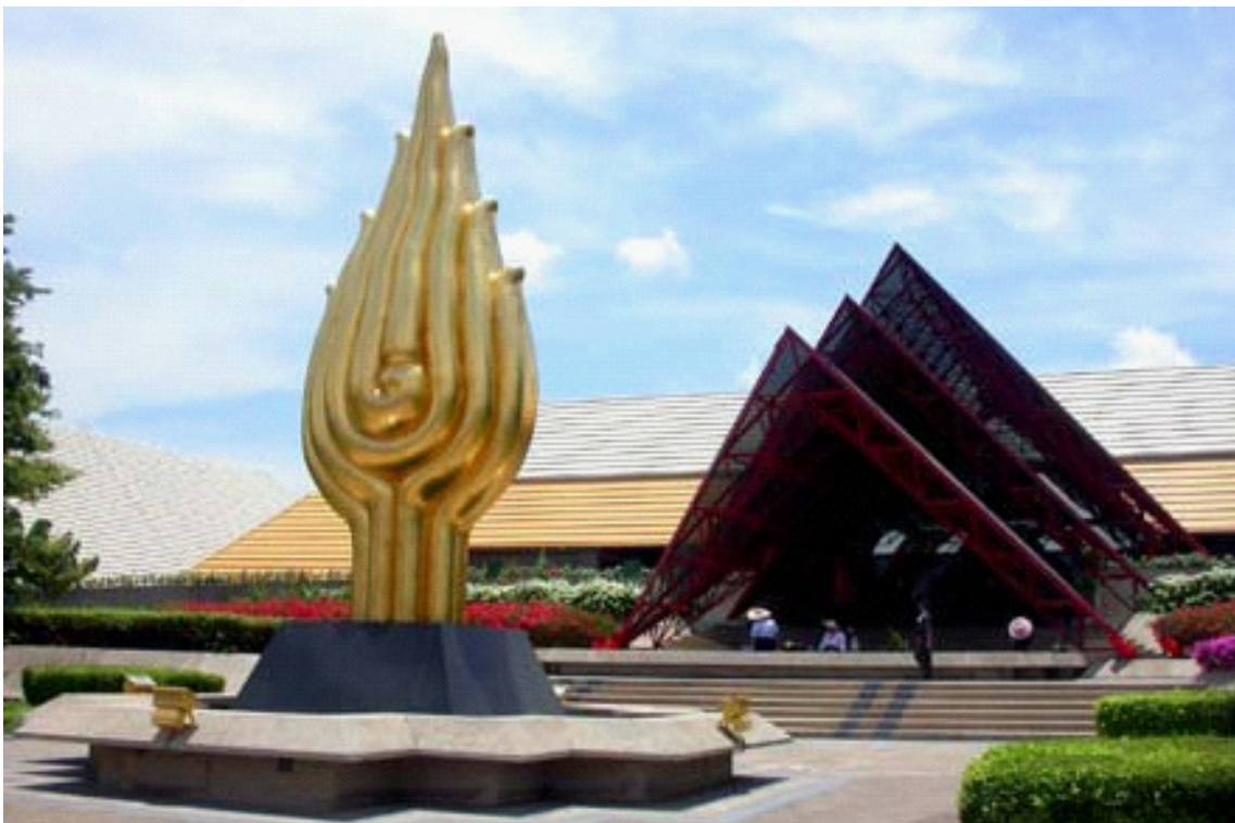
รูป 11 สัญลักษณ์อุณาโลม หน้าหอประชุมแห่งชาติสิริกิติ์

โดยในยุคทวารวดีสัญลักษณ์อุณาโลมอาจเข้ามาพร้อมกับศิลปะในศาสนาฮินดูและศิลปะในศาสนาพุทธซึ่งจะเห็นได้ว่าการพบโบราณวัตถุของทั้งสองศาสนาอยู่ปะปนอยู่ โดยตั้งแต่สมัยทวารวดีมาถึงสมัยอยุธยา นั้นสัญลักษณ์อุณาโลมคงทำหน้าที่ตรงไปตรงมาคือเป็นชนระหว่างคิ้วของพระพุทธรูป จากนั้นมีการสร้างคติเพิ่มเติมและเพิ่มคุณค่าให้กับสัญลักษณ์โดยในสมัยรัตนโกสินทร์สัญลักษณ์อุณาโลมถูกใช้เป็นเครื่องรางของขลัง ของมงคลเพื่อใช้กันภัยต่างๆ ซึ่งทำหน้าที่ต่างไปจากเดิม คือเป็นการเพิ่มขวัญและกำลังใจหรือเป็นสิ่งยึดเหนี่ยวจิตใจ ซึ่งอาจกล่าวได้ว่าสัญลักษณ์อุณาโลมเปลี่ยนหน้าที่ไปจากในช่วงแรกยันต์ตระกร้อ ที่มีอุณาโลมมียอดหัย 5 ชั้นและหัย 9 ชั้น