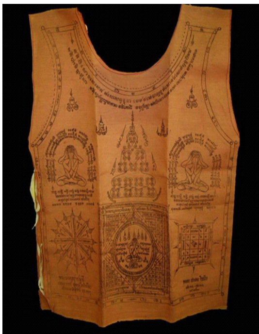
รูป 7 เลื่อยันต์ทหาร

ยอดฟ้าจุฬาโลกมหาราช (รัชกาลที่ 1) ซึ่งเป็นรูปปทุมอุณาโลม (รูปที่ 8) มีอักขระ “อุ (สัญลักษณ์อุณาโลม)” อยู่ตรงกลาง ล้อมรอบด้วยกลีบบัวอันเป็น พุทธชาติที่เป็นสิริมงคลในพุทธศาสนา อักขระ อุ หรือสัญลักษณ์อุณาโลม (อุ) มีลักษณะเป็นม้วนกลม คล้ายลักษณะความหมายของพระนามเดิมว่า (ดวง) เริ่มใช้คราวพระราชพิธีบรมราชาภิเษกเมื่อพ.ศ. 2328 และเรายังพบสัญลักษณ์อุณาโลมปรากฏอยู่ในพื้นที่ต่างๆ ที่เป็นศาสนสถานอีกมากมาย