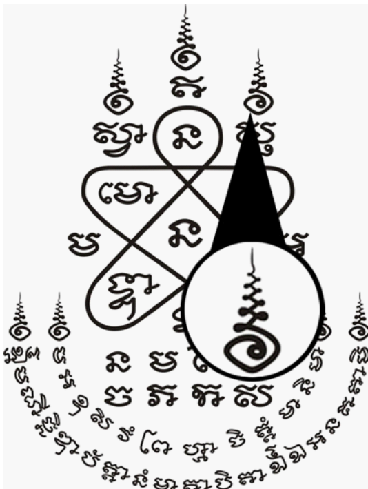
รูป 1 สัญลักษณ์อุณาโลม

“อุณาโลม” เป็นหนึ่งในสัญลักษณ์ที่เก่าแก่มาสัญลักษณ์หนึ่งในโลกซึ่งคล้ายเลขหนึ่งไทยหรือเลขเก้าไทยหรือหอยสังข์มีทั้งเวียนขวาและเวียนซ้าย และเป็นสัญลักษณ์ที่คนไทยคุ้นเคยพบเคยเห็นกันอยู่ทั่วไป บนเครื่องรางของขลังต่างๆ ภายในศาสนสถานทั้งศาสนาพุทธและฮินดู สัญลักษณ์ดังกล่าวยังถูกใช้ในทางมงคล เช่นการนำไปเจิมบ้านหรือเจิมรถ ‘สัญลักษณ์อุณาโลม’