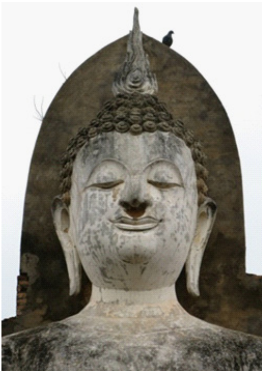
รูป 9 เศียรพระพุทธรูปศิลปะสุโขทัย