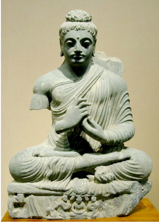
รูป 4 พระพุทธรูปศิลปะคันธาระ ประเทศอินเดีย