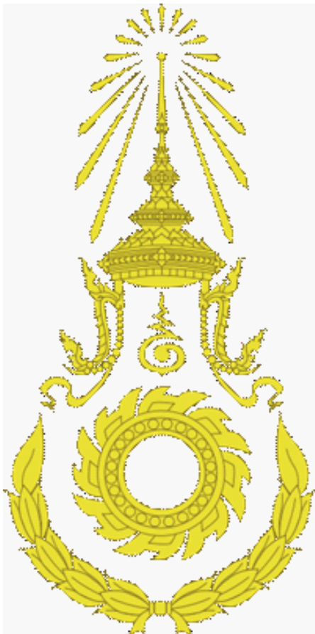
รูป 10 ตราประจำกองทัพบก

ประเทศ ทหารจากที่ต่างๆก็เกิดการแตกแยกกันภายในเนื่องมาจากมีการคุ้ยทักถมกันเรื่องเครื่องรางของขลังของตน จนตีกันทั้งกองทัพ พระบาทสมเด็จพระพุทธยอดฟ้าจุฬาโลก (รัชกาลที่ 1) และกรมพระราชวังบวรจึงเรียกเก็บบริบเครื่องรางของขลังมาทั้งหมดแล้วทำพิธีพุทธาภิเษกผ้ายันต์ที่มีสัญลักษณ์อุณาโลมแจกให้เหมือนกันทั้งกองทัพ เป็นเหตุให้กองทัพไทยมีความเป็นน้ำหนึ่งใจเดียวกันสามารถตีกองทัพพม่าที่มีกำลังมากกว่าแตกพ่ายได้ชัยชนะเป็นเด็ดขาด” จากนั้นมาสัญลักษณ์อุณาโลมก็ได้กลายเป็นตราประจำกองทัพบก (รูปที่ 10) ตลอดจนเป็นส่วนหนึ่งของตราประจำหน่วยงานต่างๆ ของกองทัพ