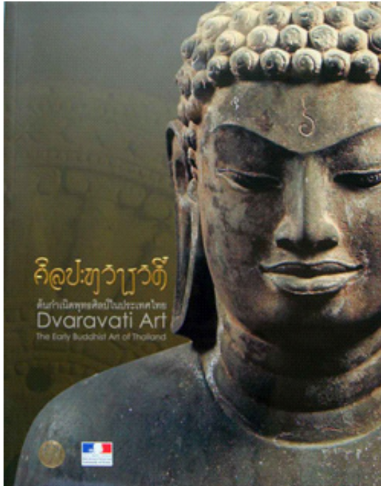
รูป 6 พระพุทธรูปศิลปะทวารวดี